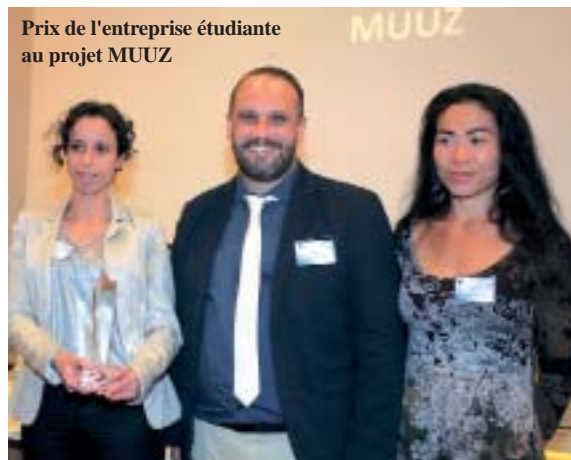
Prix de l'entreprise étudiante au projet MUUZ