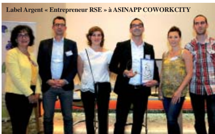
Label Argent « Entrepreneur RSE » à ASINAPP COWORKCITY