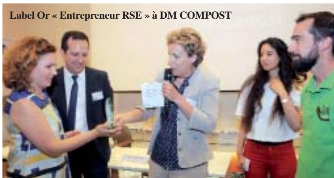
Label Or « Entrepreneur RSE » à DM COMPOST

Green Creative est une entreprise CleanTech spécialisée dans la conception, la fabrication et la commercialisation de solutions innovantes pour le traitement et le tri des déchets. Elle se situe à Sucy-en-Brie.