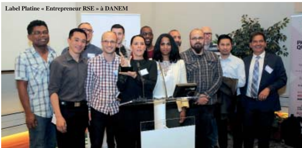
Label Platine « Entrepreneur RSE » à DANEM

Outre la remise des labels aux lauréats, d'autres entreprises, qui se sont distinguées en 2018, ont été mises à l'honneur et ont reçues d'autres trophées tels « Entreprise Innovante », « Jeunes en Entreprise », « Entreprise Etudiante » et enfin « Coup de cœur 2018 ».