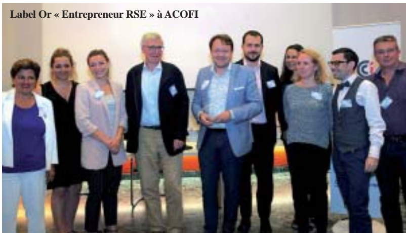
Label Or « Entrepreneur RSE » à ACOFI