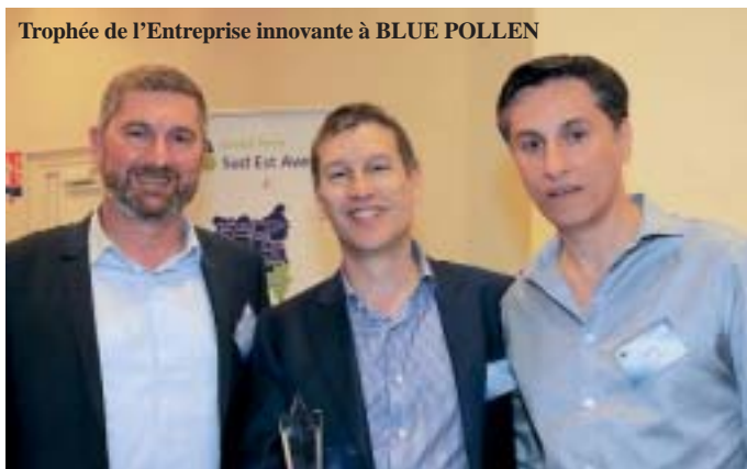
Trophée de l'Entreprise innovante à BLUE POLLEN