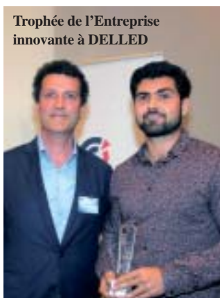
Trophée de l'Entreprise innovante à DELLED