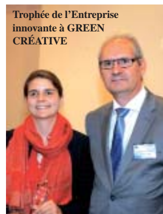
Trophée de l'Entreprise innovante à GREEN CRÉATIVE