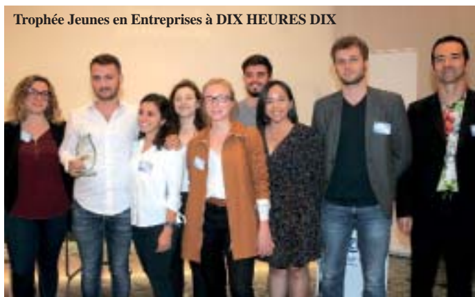
Trophée Jeunes en Entreprises à DIX HEURES DIX