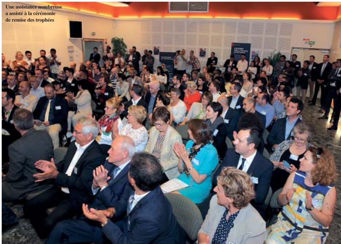
Une assistance nombreuse a assisté à la cérémonie de remise des trophées