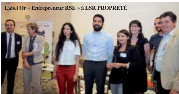
Label Or « Entrepreneur RSE » à LSR PROPRETÉ