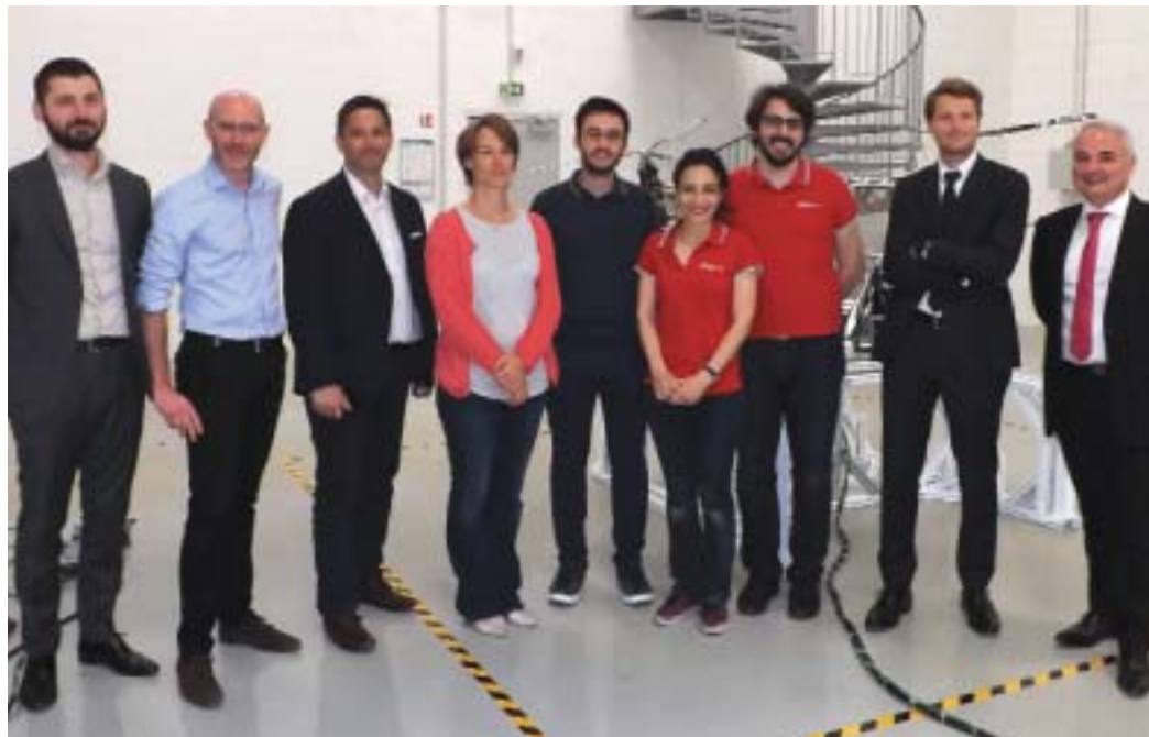
C'est en présence des partenaires principaux d'Aérial Coboticus (Siemens, Kuka, Réseau Entreprendre 94 et Icade Paris Orly-Rungis) que les locaux spacieux, et adaptés à leurs besoins, ont été inaugurés.

Aérial Coboticus produit un drone industriel voué à un avenir très prometteur (voir article en page ci-contre). Cette pépite de notre territoire devait partir de ses locaux de Saint-Maur, mais il était