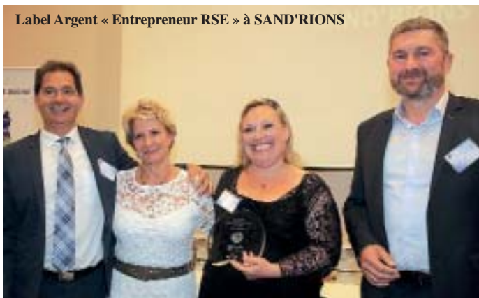
Label Argent « Entrepreneur RSE » à SAND'RIONS